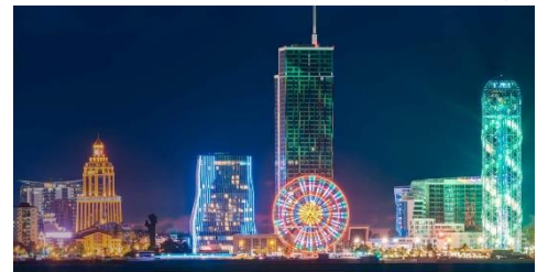
Batumi International Airport TAV Airports airBaltic

2 მაისიდან კი კომპანია Air Baltic ბათუმის საერთაშორისო აეროპორტში პირველად დაიწყებს ოპერირებას. ლატვიის ეროვნული ავიაკომპანია ფრენებს რიგა-ბათუმის მიმართულები კვირაში ორჯერ, Airbus 220 ტიპის საჰაერო ხომალდებით შესრულებს. Air Baltic თბილისის საერთაშორისო აეროპორტში 2006 წლიდან ოპერირებს. ავიაკომპანია ზაფხულის სეზონზე რიგის მიმართულებით ფრენებს კვირაში ოთხჯერ ასრულებს.